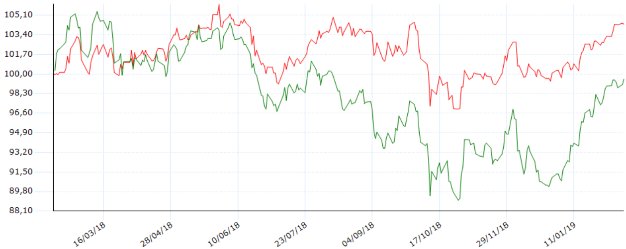
— OSSIAM EMERGING MARKETS MINIMUM VARIANCE NR UCITS ETF 1C (MI) — Indice Azionari Mercati Emergenti - Internazionali